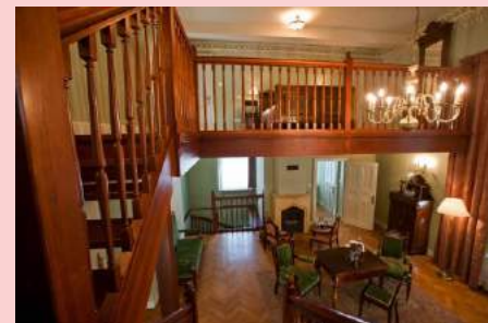
Apartament de Luxe