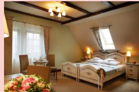
Pokój 2 os. budynek Stodoła