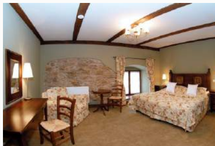
Pokój 2 os. budynek Spichlerz