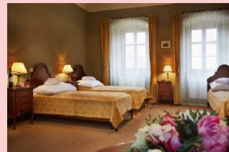
Pokój 2 os. budynek Oficyna