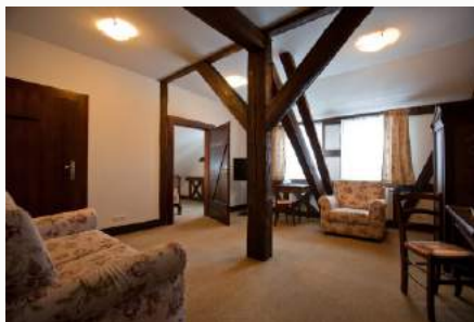
Pokój 2 os. budynek Stajnia