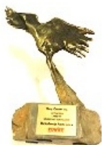
NAJLEPSZA INWESTYCJA PODKARPACIA 2013